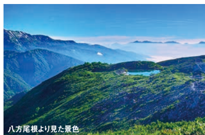
八方尾根より見た景色