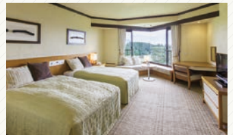
琵琶湖マリオットホテル