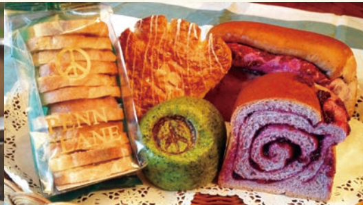
ペニーレーン(ホテルより車で約10分)