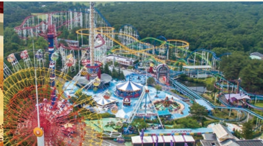
那須ハイランドパーク(ホテルより車で約20分)