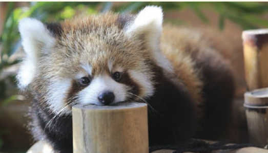
那須どうぶつ王国(ホテルより車で約35分)

那須連山の雄大な自然と、四季折々の花が満喫できるスポット。秋はケイトウやコスモスなど約20種類の花が開花します。(ホテルより車で約25分)