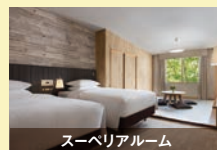
スーペリアルーム