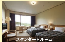
スタンダードルーム