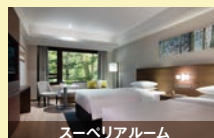
スーペリアルーム