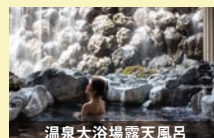
温泉大浴場露天風呂