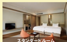
スタンダードルーム