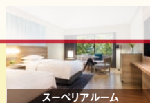
スーペリアルーム