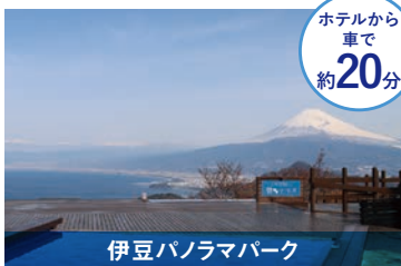
伊豆パノラマパーク