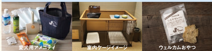
愛犬用アメニティ