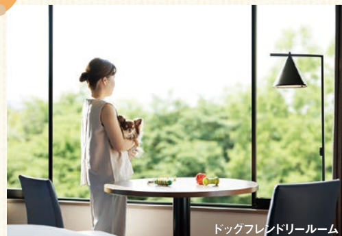
ドッグフレンドリールーム