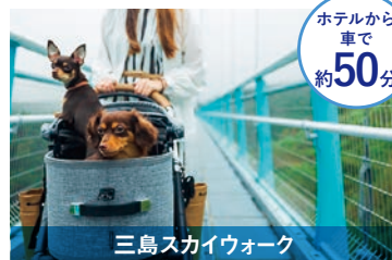
三島スカイウォーク