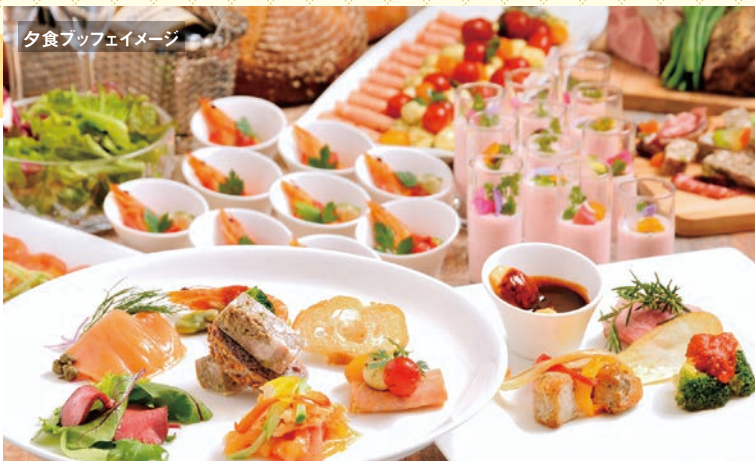
夕食ブッフェイメージ