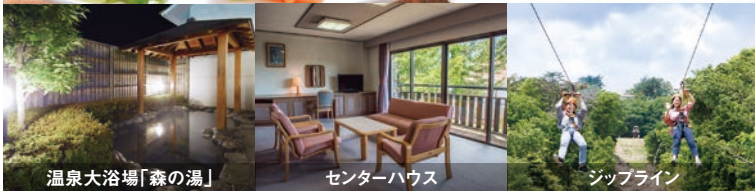
温泉大浴場「森の湯」