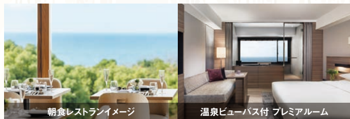
朝食レストランイメージ