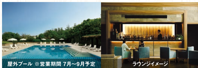
屋外プール ※営業期間 7月~9月予定