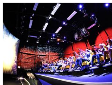
XD ダークライド イメージ