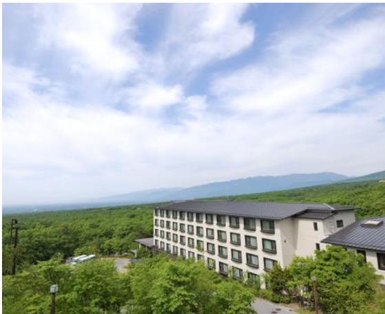
那須高原を見渡すラフォーレ那須